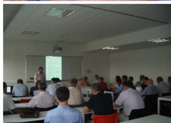
Soirée de l'Assemblée Générale – KEDGE Business School (Talence), 9 juin 2015